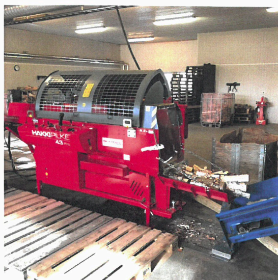
Ny vedmaskin installert

Vedsentralen har i løpet av 2021, installert ny Vedmaskin og tørkekammer. Sistnevnte er et forsøk på å øke mengden salgbar ved i vintermånedene, og på sikt kunne legge til rette for flere arbeidsplasser. Tørking av ved er fortsatt i en test fase, hvor kostnadene må evalueres i løpet av 1. halvår. 2022. Vedmaskin og tørkekammer er finansiert gjennom midler fra Elverum kommunes disposisjonsfond.