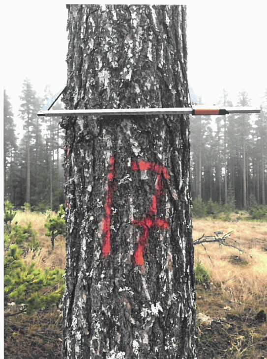
Utsyning av strømstolper i Kirkebergskogen

Markedet for massevirke har vært preget av jevnt god tilgang for industrien og der igjen stabilt lave priser gjennom hele året. Ved årets utgang er det en prisdifferanse på 350 - 400,- mellom massevirke og sagtømmer. Gjeldende prisnivå for massevirke er utfordrende med tanke på lønnsomhet i 1.gangs tynning.