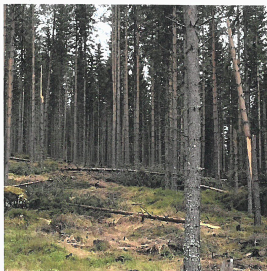
Snøbrekkskader i Hakaskallen

Tung snø uten tilstrekkelige mildværsperioder resulterte for enkelte områder, større skader i perioden februar til april. De store skadene oppstod i østvende hellinger i høydelagene 400-550 moh. Skadene ble taksert av Skogbrand forsikringsselskap. Ettersom majoriteten av skadeområde var i størrelsesorden 2-5 daa, gjaldt ikke forsikringen da innslaget først skjer ved 10 daa. I tillegg må 25 % eller mer av sammenhengende skadeområde >10 daa være ødelagt. Det ble besluttet å rydde opp i de områder som ville gi en positiv rotnetto og som ikke ville skape kjøreskader eller skader på gjenstående skog.