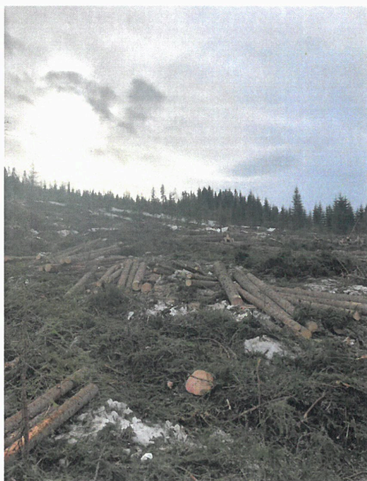
Tømmerdrift i Ulvådalen i februar

Ved inngangen til 2021 var tømmermarkedet sterkt med høy etterspørsel etter sagtømmer. I følge markedssignalene ville sagtømmerprisene flate ut og muligens falle fom. 2. halvår. Med bakgrunn i stabil høy byggeaktivitet og omfattende skader fra granbarkbille i Europa og Nord Amerika, oppstod det motsatte hvor etterspørselen etter norsk sagtømmer og trelast fortsatte å stige med påfølgende økte sagtømmerpriser gjennom hele året. Prisutviklingen for sagtømmer har imidlertid vært lavere enn prisutviklingen for trelast.