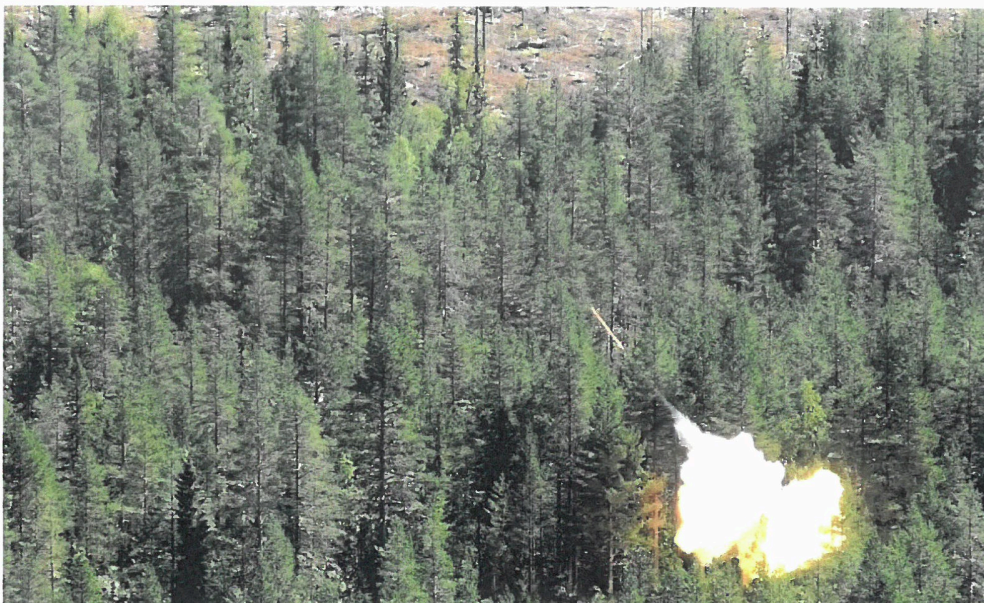
Testskyting fra 40 km standplass i Ulvådalen.