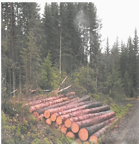
Laftetømmer fra Kirkebergskogen til Materialbanken i Vingelen

Med bakgrunn i markedssignalene og den likvide situasjonen i begynnelsen av året, ble det meste av budsjettvolumet avvirket i perioden januar - mars. Tung snø og lite mildvær gjennom vinteren resulterte for enkelte geografiske områder, omfattende snøbrekkskader. Ved kartlegging av skogskader i mai og juni måned, ble det besluttet å rydde opp i områdene Hakaskallen og Bjølset. Oppryddingen er foregått gjennom både tynninger/gjennomhogster og sluttavvirkning.