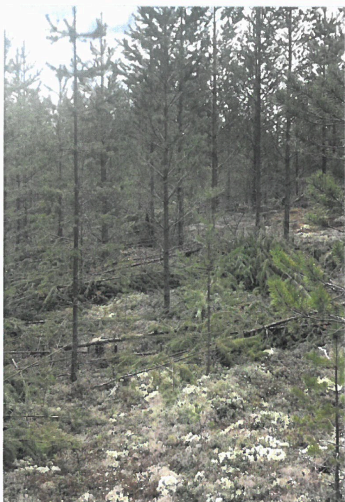
Avstandsregulert felt i Enkeberget, Heradsbygda