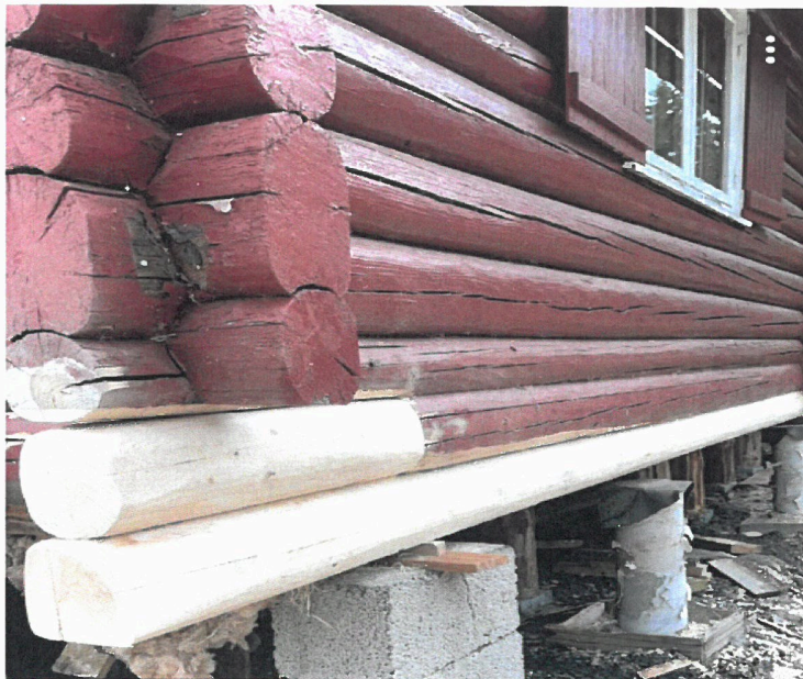
Utskifting av råtne bunnstokker på Elgstua i Hakaskallen

11 stk. – åremålsutleie, 3 stk. – åpne for allmenn bruk og 4 stk. – ikke utleid på grunn av dårlig standard. Leiesum for skogshusværene på utleie, er som oftest regulert gjennom avtalte vedlikeholdsoppgaver, ved at koieleier utfører arbeidet og KFEK betaler for materiellet. KFEK har en strategi om å bevare skogshusværene. Med denne utleieordning opprettholder Elverum kommune en god standard på byggene uten store kostnader.