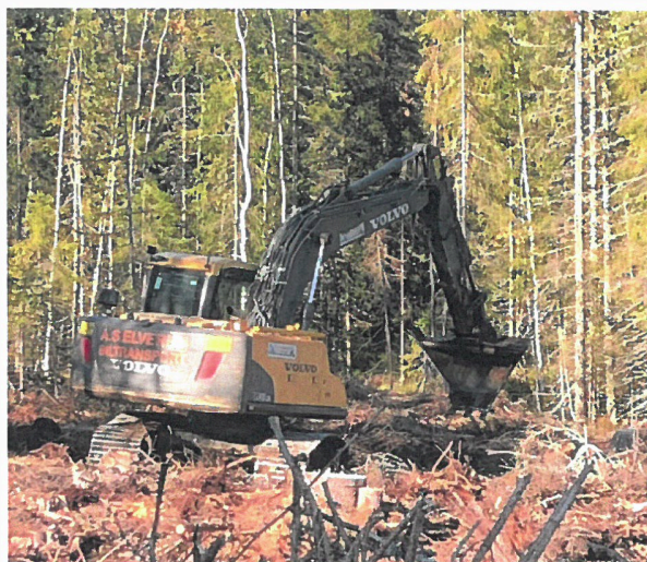
Markberedning og grøfterensk i Kirkebergskogen