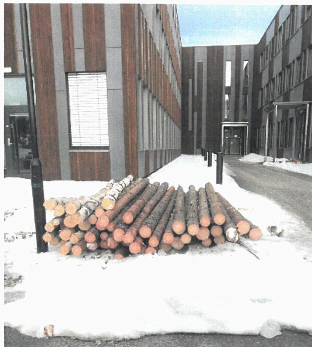
Virke til bruk i Terningen Innovasjonspark. Virket er hogget i henhold til spesifikke lengde-, diameterkrav. Kvisting ble foretatt uten å berøre bark på stammen.

KFEK har gjennom manuell drift, levert virke til den nye Terningen innovasjonspark. Leveransekostnaden er det KFEK som har stått for.